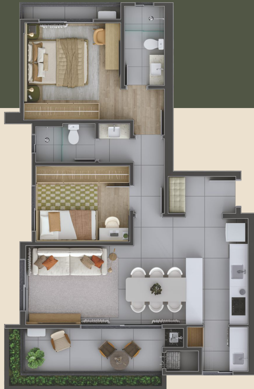
TIPO 2 | finais 2 e 5