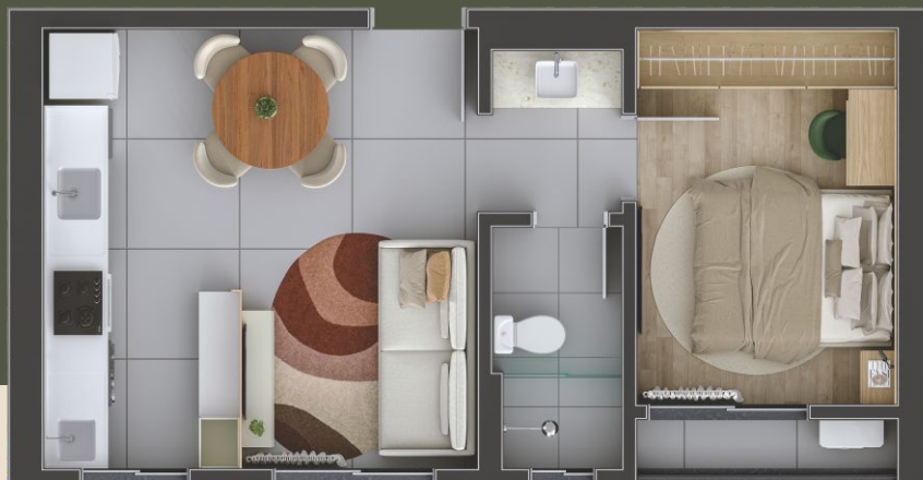
TIPO 1 | finais 1 e 6